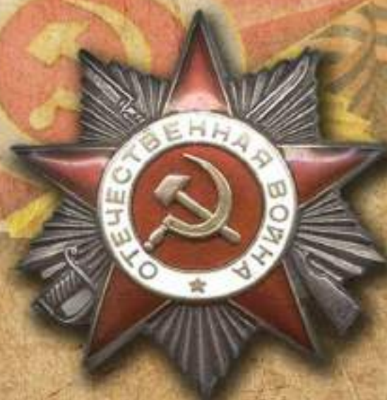
Орден Отечественной войны II степени